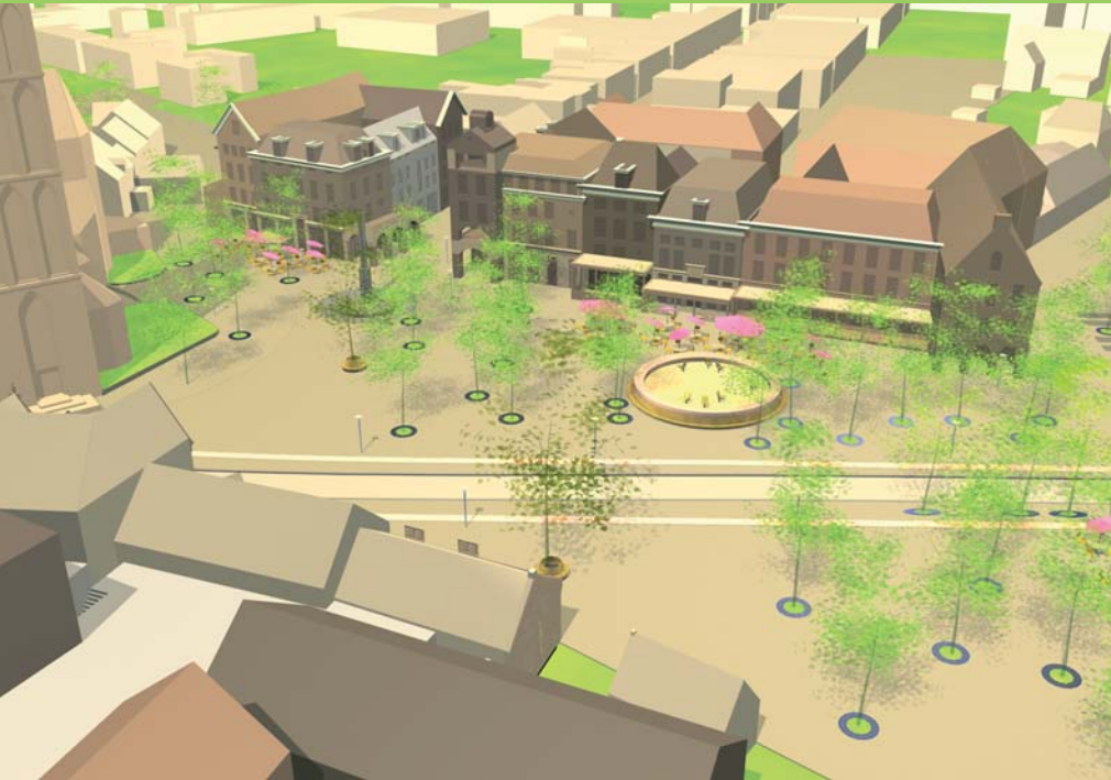
Impressie van het toekomstig Wilhelminaplein door DLA+ landschapsarchitekten.

Met de Integrale Ontwikkelingsvisie Centrum Tegelen (IOCT) willen Venlo en Antares Woonservice de achteruitgang omkeren. In het IOCT wordt bepaald in welke richting zich het centrum zou moeten ontwikkelen. Het gaat dus om een toekomstbeeld. Daarmee wordt ook bepaald wat er niet moet gebeuren. Als bijvoorbeeld in zo'n visie wordt vastgelegd dat in een bepaald gebied kleinschalige economische activiteit nodig is, dan kan daar wel een antiekwinkeltje komen maar niet het hoofdkantoor van een internationale bank.