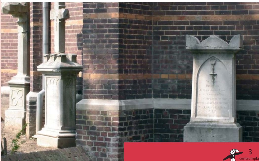
Grafstenen, die van het voormalige kerkhof bewaard gebleven zijn

De menselijke resten kunnen ons veel vertellen over het leven van de overledenen, hun leeftijd en geslacht, eventuele ziekten, welstand en dergelijke. Eventuele religieuze voorwerpen in de graven kunnen ons vertellen over de denkwereld van de overledenen.