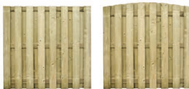
Schutting: recht model en toegmodel

Antares heeft een gelimiteerd budget voor het plaatsen van huurschuttingen. Dat betekent dat wij per maand slechts een beperkt aantal aanvragen kunnen uitvoeren en dat aanvragers rekening moeten houden met een wachttijd.