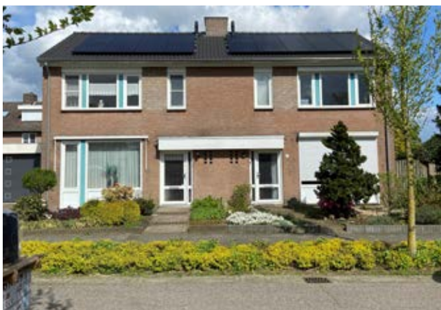
In de Haag, Meijel